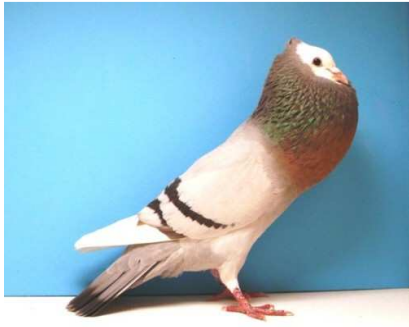
0,1 Schweizer Kröpfer, mehllicht mit Binden, EU-Schau 2010 V 97 TZB, Ausst.: Martin Glauser, CH