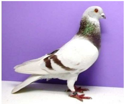
1,0 Poster, rotfahl, EU-Schau 210 V 97 EB, Ausst.: Hans-Joachim Fuchs, D