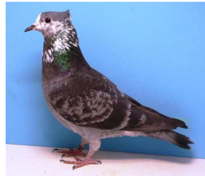
1,0 Berner Gugger, Blauschwanz, EU-Schau 2010 V 97 EB, Ausst.: Alain Julmy, CH