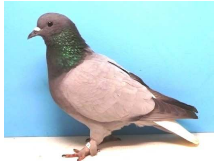
1,0 Zürcher Weisschwanz, blau ohne Binden, EU-Schau 2010 V 97 SVB, Ausst.: Peter Niederklopper, A