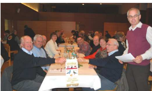
Gute Stimmung unter Deutschen und Schweizer Züchter!