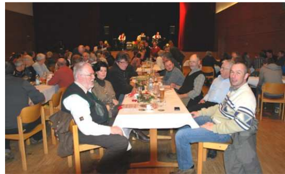
Glückliche Gesichter von Züchtern aus Frankreich und der Schweiz.