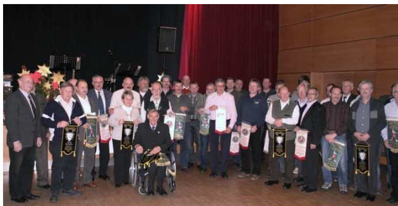
Die Erringer der Ehrenbänder stellen sich zu einem eindrucksvollen Gruppenfoto.