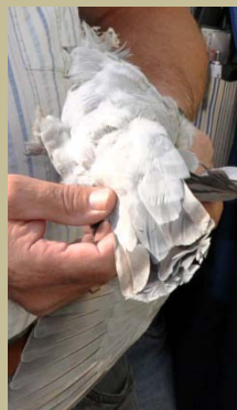
SV-Vorsitzender und Sonderrichter Wolfgang Pfeiffer gibt Hinweise zur Bauchfarbe, aber auch die Rückenfarbe muss beachtet werden.