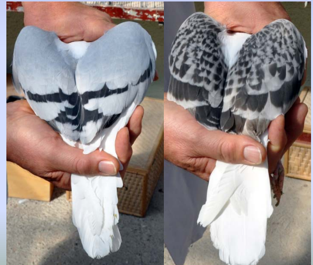
Zuchtwart Fuchs vergleicht die Standardbilder mit den hier vorgestellten Tieren. Die Fotos rechts zeigen den Kopf und die Flügelzeichnungen von Thurgauer Schildtauben.